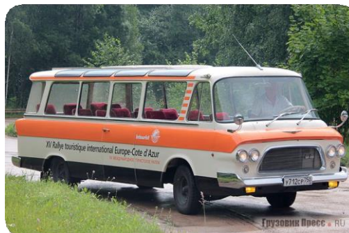
ЗИЛ 118 Юность