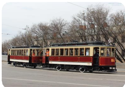
Моторный вагон «Ф» № 164

Основная техника от ГУП «Московский метрополитен»: