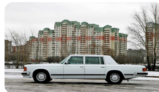
ЗИЛ 41041 седан