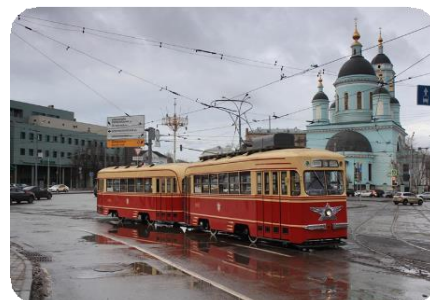
Моторный вагон КТМ-1 № 0002