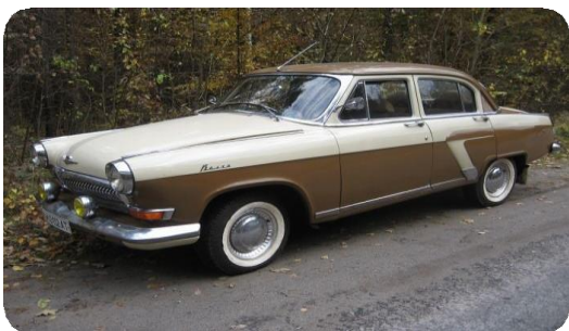
ГАЗ 21 выпуск 3