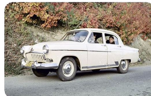
ГАЗ 21 выпуск