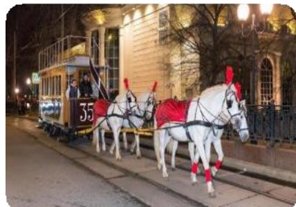
Вагон трамвайный-конка № 35

Ретроавтомобили «Москвич», 10 – 15 машин (выставка «Из прошлого в будущее»):