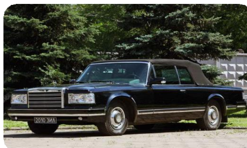
ЗИЛ 41041 кабриолет