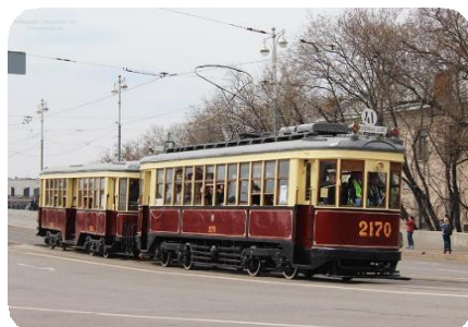
Моторный вагон «КМ» № 2170