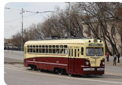
МТВ-82 № 1278