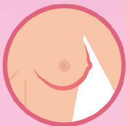
Уплотнения в груди, спаянные с окружающими тканями