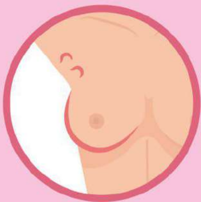
Боль как в молочной железе, так и в сосках