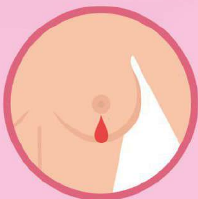
Выделения из молочной железы