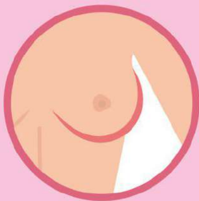
Изменение формы и втягивание соска

ВАЖНО! «Нулевая» и «первая» стадии рака выраженных симптомов не имеют